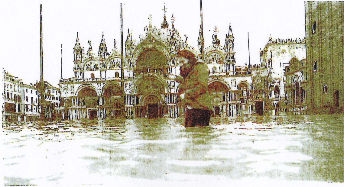
浸水したサンマルコ広場を横切る女性 13日 ベネチア