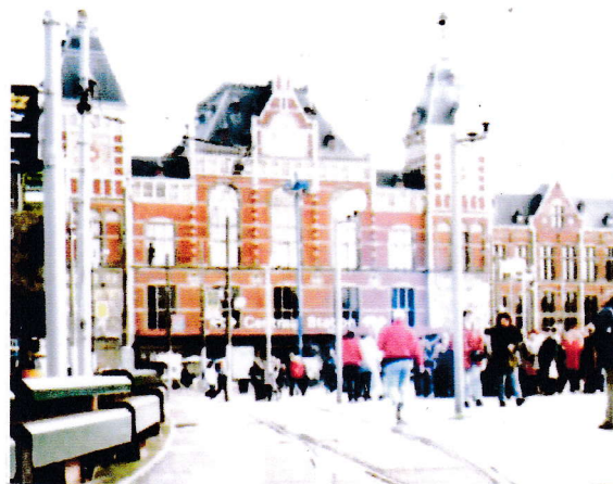
東京駅 そっくりで びっくりしました